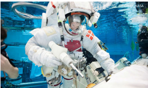
↑ ESA-astronaut Andreas Mogensen beim Training für Weltraumspaziergänge im Neutral Buoyancy Laboratory in Houston, USA.

Bei der Montage oder Wartung von Objekten im Weltraum müssen die Astronaut*innen über eine gute Fingerfertigkeit und Hand-Augen-Koordination verfügen und im Team arbeiten. Sie müssen auch in der Lage sein, Werkzeuge und Gegenstände zu handhaben, während sie einen unter Druck stehenden Raumanzug mit Handschuhen tragen. Diese Handschuhe, die Astronaut*innen vor der Weltraumumgebung schützen sollen, können dick und sperrig sein. Sie sind so beschaffen, dass die Astronaut*innen bei einer EVA ihre Finger so leicht wie möglich bewegen können. Sie müssen lernen, mit den Handschuhen zu arbeiten und sowohl roße als auch kleine